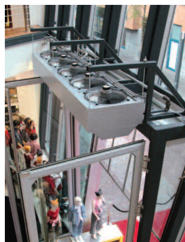
TIC im Designerladen